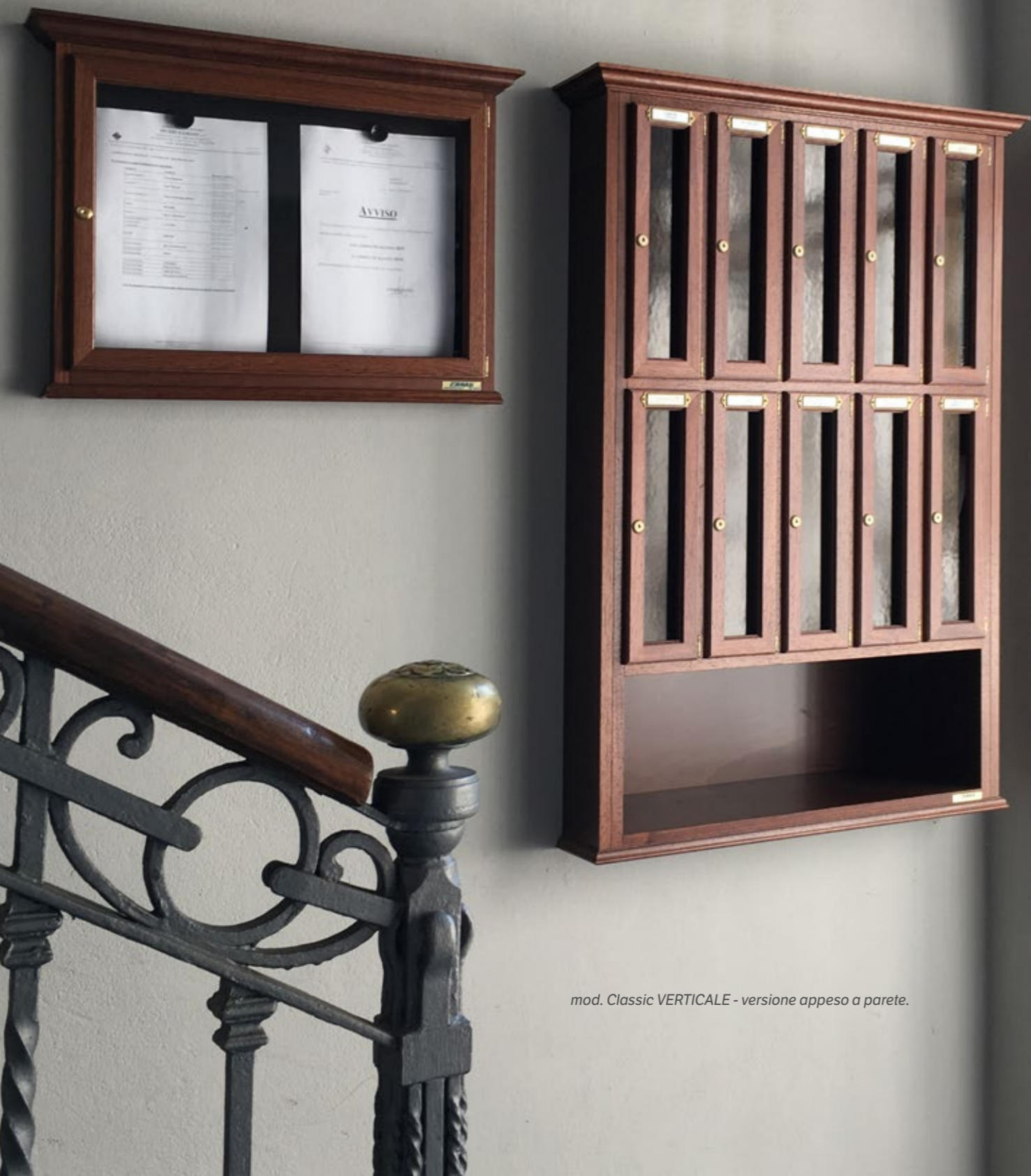
mod. Classic VERTICALE - versione appeso a parete.